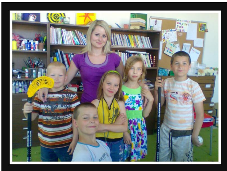
Dobrovolnice pracující s dětmi na MmP.

Rok 2011 byl Evropským rokem dobrovolnictví, jehož hlavním poselstvím bylo podpořit rozvoj dobrovolnických aktivit, zvýšit povědomí o významu a hodnotě dobrovolnictví s cílem vedoucím k aktivnímu občanství.