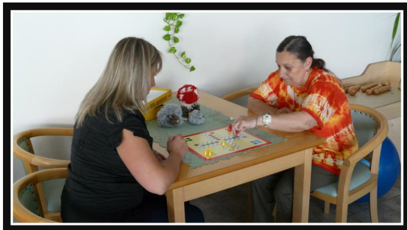
Dobrovolnice při hraní společenských her v domově pro seniory.