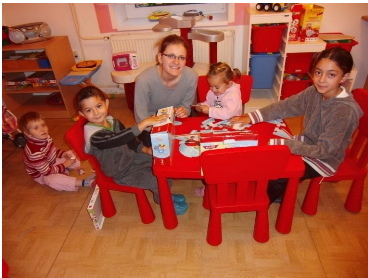
Dobrovolnice v dětském centru s dětmi z azylového domu.

V rámci dobrovolnického centra fungují 2 akreditované dobrovolnické programy Ministerstva vnitra ČR: