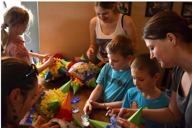
Dobrovolnice pomáhající v Centru pro integraci cizinců v Pardubickém kraji.

Dobrovolníci pomáhají v níže jmenovaných sociálně nebo zdravotně zaměřených organizacích, kde doplňují práci profesionálních pracovníků. Věnují část ze svého volného času na pomoc těm, kteří to potřebují bez nároku na finanční odměnu. Pomáhají zejména v oblastech volnočasových a vzdělávacích aktivit. Jejich činnost je pozitivně oceňována jak přijímajícími organizacemi, tak také uživateli služeb či pacienti.