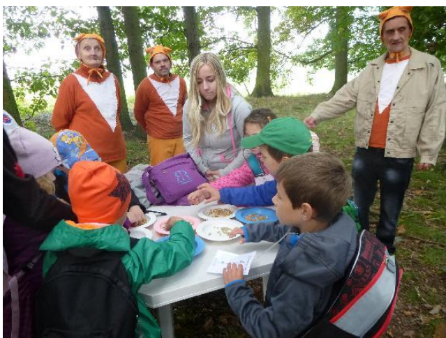
Pohádkový les. Dobrovolnice pomáhá uživatelům Domova pod Kuňkou v Rábech.

V roce 2014 vyslalo dobrovolnické centrum celkem 94 dobrovolníků do výše zmíněných organizací, kteří odpracovali téměř 2 000 hodin.