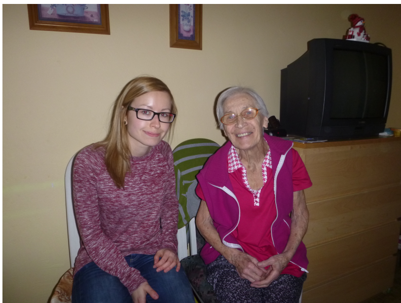
Dobrovolnice, která dochází za seniorkou v Domově pro seniory v Pardubicích.

Dobrovolníci pomáhají v níže jmenovaných sociálně nebo zdravotně zaměřených organizacích, kde doplňují práci profesionálních pracovníků. Věnují část ze svého volného času na pomoc těm, kteří to potřebují bez nároku na finanční odměnu. Pomáhají zejména v oblastech volnočasových a vzdělávacích aktivit. Jejich činnost je pozitivně oceňována jak přijímajícími organizacemi, tak také uživateli služeb či pacienty.