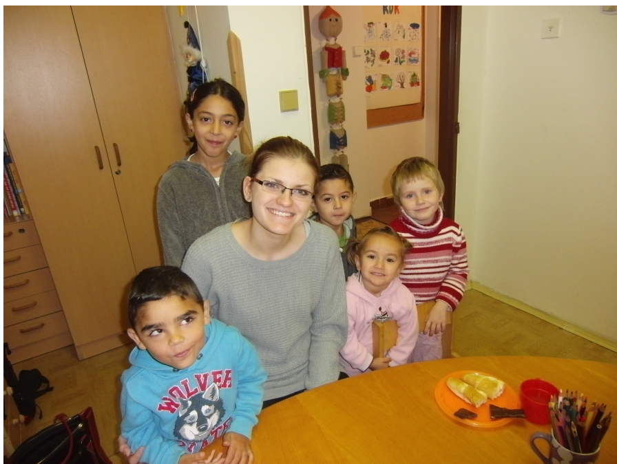
Dobrovolnice jsou v Dětském centru azylového domu vždy vítány.

V rámci dobrovolnického centra fungují 2 akreditované dobrovolnické programy Ministerstva vnitra ČR dle zákona o dobrovolnické službě č. 198/2002Sb.