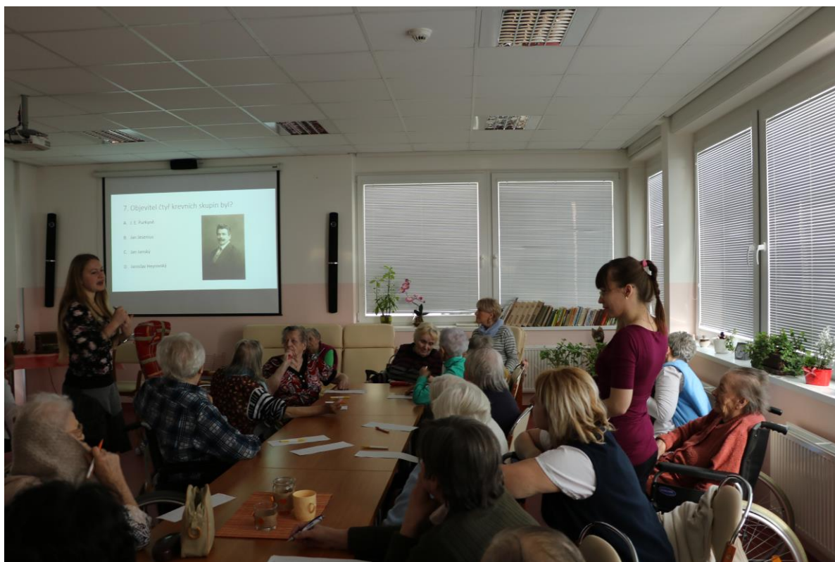
Dobrovolnice si pro seniory připravily kvíz, který si všichni příjemně užili.